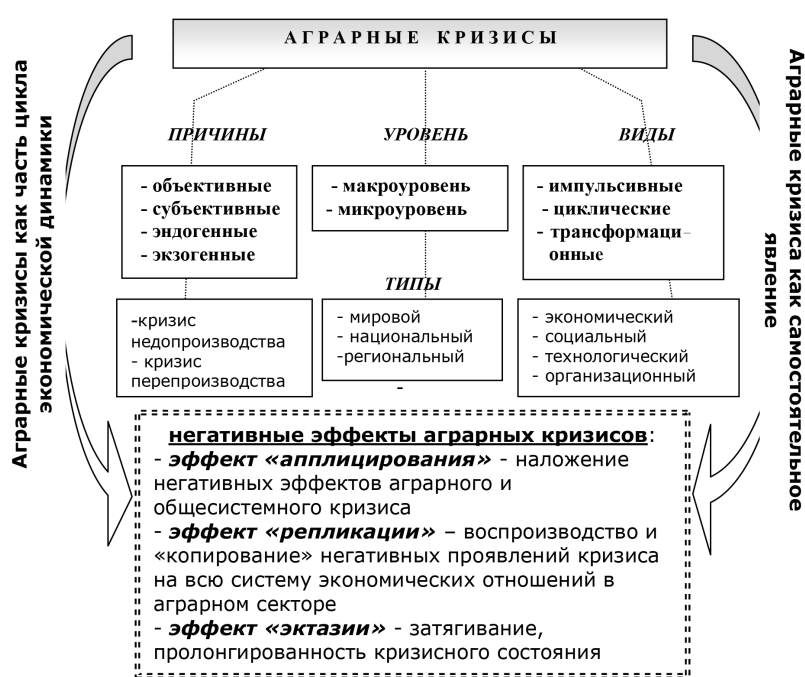
Рис. 3. Идентификация, типология и обусловленность аграрных кризисов

за нелинейных динамических систем 6 . Согласно теории циклических процессов, в процессе кризисной фазы, как сложной фазы перехода из одного качественного состояния в другое, наблюдается рассогласование между различными подсистемами и элементами, которое выражается в том, что отдельные подсистемы и элементы уже осуществили переход к новому качественному уровню, а другие остались на прежнем уровне. Трансформации второго порядка могут влиять на поведение одной из подсистем и не совпадать с глобальными кризисами. Следовательно, подсистемы внутри системы имеют собственный цикл, программу развития. Продолжительность циклов развития системы, подсистем и входящих в них элементов различается и синхронизируется между собой сложным образом с помощью системы управления.