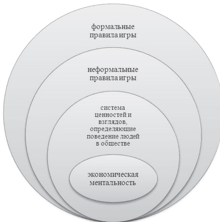
Рис. 1. Структура института

ментальности как базовому неформальному институту, который определяет как неформальные, так и формальные институты, а также обеспечивает вектор взаимодействия и стратегию реформирования социально-экономической системы (см. рис. 1).